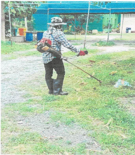
ภาพการทำกิจกรรม